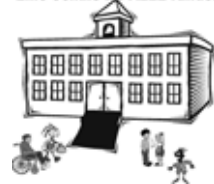
Eine Schule für ALLE Kinder